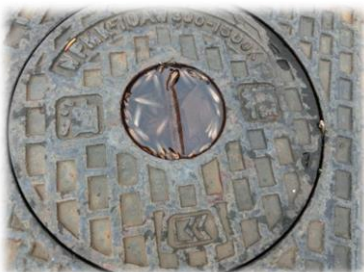
マンホールの蓋のくぼみ