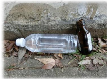
屋外に放置された空きビン、缶、ペットボトル