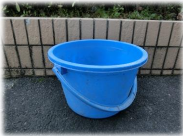
雨ざらしのバケツ、じょうろ