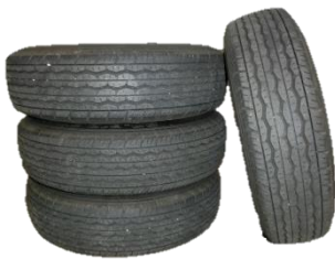
古タイヤに溜まった水たまり