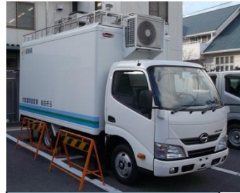
大気環境測定車 あおぞら号(移動局)